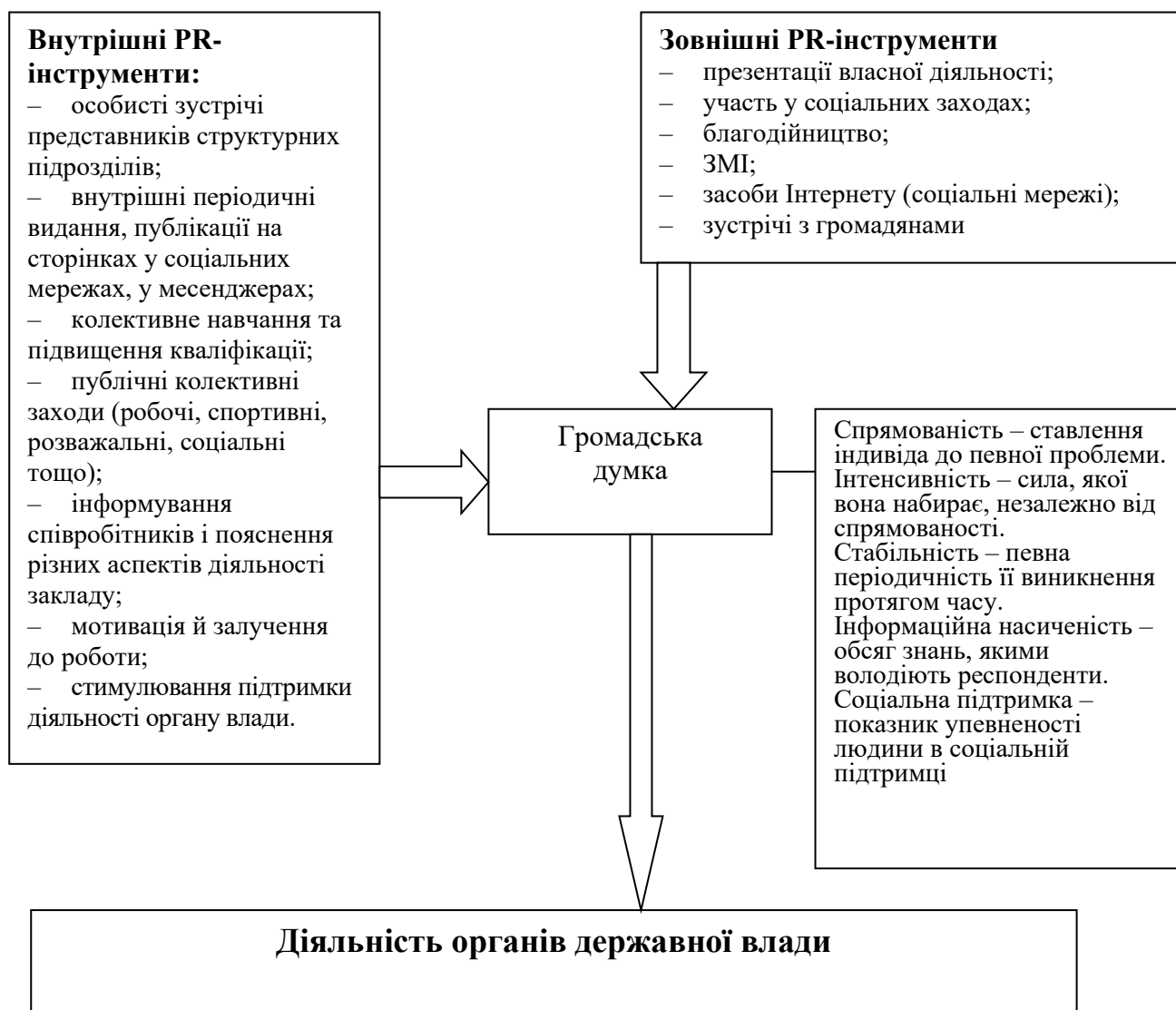
Рис. 3. Механізм функціонування зв'язків із громадськістю в системі державного управління (удосконалено авторкою)

проти дія негативним інформаційно-психологічним пропагандистським впливам та захист національного інформаційного простору від маніпуляцій, інформаційних війн і операцій. Особливо це важливо в сучасних умовах, коли з 2014 р. окремі території Донецької та Луганської областей стали непідконтрольними українській владі. Під впливом цих подій і тих, які їм передували, інформаційна безпека України (зокрема вітчизняний інформаційний простір) опинилася під загрозою через зовнішні негативні пропагандистсько-маніпулятивні чинники. Тому й у цьому контексті діяльність органів державної влади щодо зв'язків із громадськістю наразі є надзвичайно актуальним питанням.