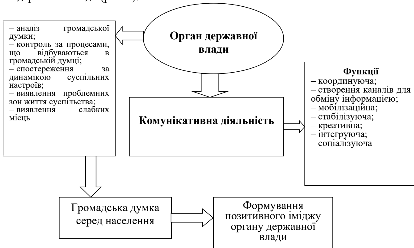
Рис. 2. Напрями вдосконалення комунікативної діяльності органу державної влади (удосконалено авторкою)

Запропоновано напрями вдосконалення комунікативної діяльності органу державної влади (рис. 2).